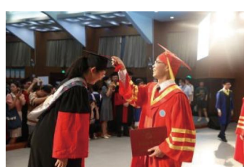
图为院士、校领导为2022届毕业生代表拨穗并颁发毕业证书