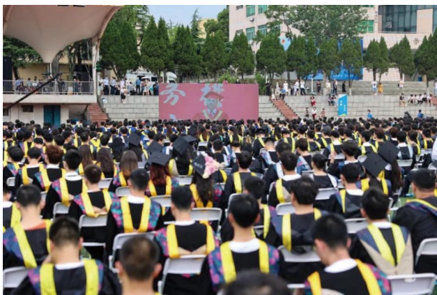
图为南望山校区毕业典礼现场

“回首来时路，白云深几重。”历经沧桑的中华民族，曾经创造过无与伦比的辉煌，也面对过近代以来空前严重的民族危机，正是中华民族儿女们坚持不懈的奋斗，敢为人先的探索，百折不挠的尝试，气吞山河的行进，才得以实现民族独立和人民解放。100年前，从上海石库门、嘉兴南湖出发，中国共产党让流动的时光有了精神的刻度，让变动的历史有了确定的航道，探寻了一条从筚路蓝缕走向伟大复兴的强国之路，绘制了一张从星星之火点亮万里山河的恢宏画卷，奏响了一曲“江山就是人民，人民就是江山”的初心之歌。70年前，应国家所需，地大人干起了“动地”的事业，从学院路29号到鲁磨路388号、锦程街68号，一路荆棘丛生、充满坎坷，但一代代地大人踔厉奋发，笃行不怠，传承红色血脉、坚守育人初心，谱写了地质报国、资源富国、科教强国、环境护国，建设特色鲜明高水平大学的华彩篇章。基于长期以来对校史和地质学史的研究，我近年来常常提醒新入职的老师：地大崇尚真英雄、胸怀大理想，地大人要有恢弘之格局和非凡之气魄。翻开历史之书，字字引人深思，句句催人奋进：书写的荣光背后，绝不是一蹴而就、一帆风顺、一片祥和，而是充满着挫折、坎坷、危机、变局，但是当复兴巨轮有“主心骨”把舵领航，前行列车有“信号灯”指引，人民伟力插上“中国梦”的翅膀，就没有什么能阻挡我们前进的步伐。