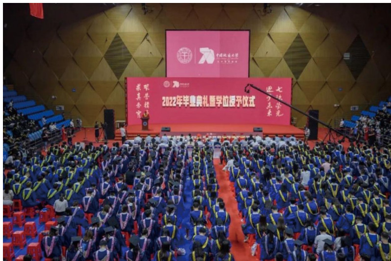
图为未来城校区毕业典礼现场

这几年，你们在扎根向上、不断成长的同时，学校和你们一样只争朝夕，丝毫不敢懈怠，锚定地球科学领域世界一流大学的目标，爬坡过坎、奋力前行：我们迁汉后二次创业，建成未来城校区并投入使用，有效拓展了学校办学空间，为这所伟大学校的事业长青奠定了新基石；我们聚焦国家需求，描绘了美丽中国·宜居地球的发展蓝图；我们持续优化学科生态，高质量达成首轮“双一流”建设目标，高起点启动新一轮“双一流”建设任务；我们锐意进取，推动更深层次改革、更高水平开放，努力实现更高质量发展。我们不断完善“三融合”本科人才培养模式，构建“三融三跨”的高质量研究生教育体系，就是为了供给更优质的教育资源。我们推行主辅修制，就是想即使学校日子紧一点、老师辛苦一点，也要让你们多学一点；我们严格论文查重、盲审、答辩各环节，就是想即使论文虐你千百遍，也要让你们的过往和经历都能经受得住历史的检验；我们坚持“严在地大”，就是想现在你们多吃点苦，以后尽量少遭些罪。我知道你们期待：通识教育课程可选择再多一点、实践教学再强一些、上课安排离寝室再近一些、住宿生活条件再好一点、文化体育设施再齐全一些、出入校门再便捷一些……这些将鞭策我和我的同事们努力、再努力一些！从今天起，我们会不断提醒我们自己，地大校友又新增了7000多双眼睛将时刻盯着我们！