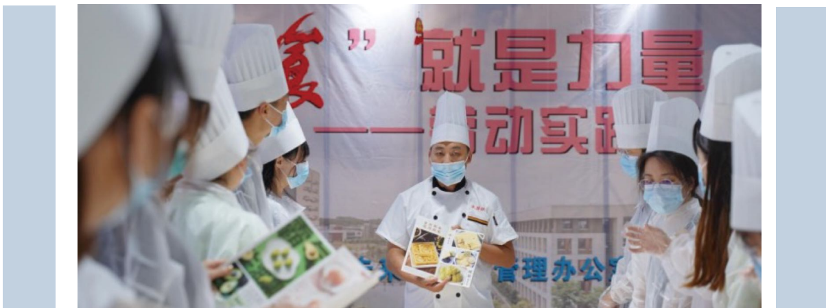
图为老师介绍端午节的历史起源和节日风俗