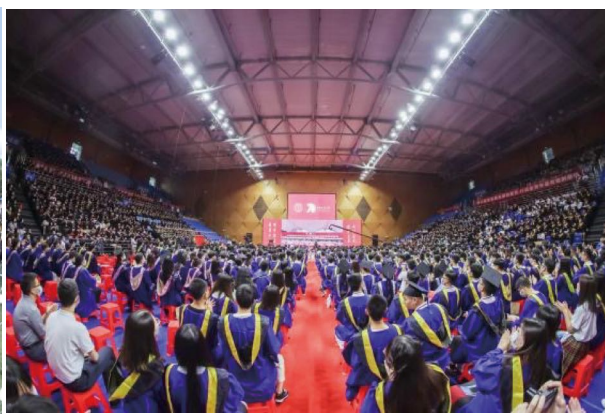
图为未来城校区毕业典礼现场