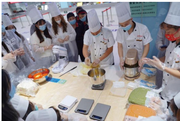
图为老师介绍制作绿豆糕的具体步骤和方法