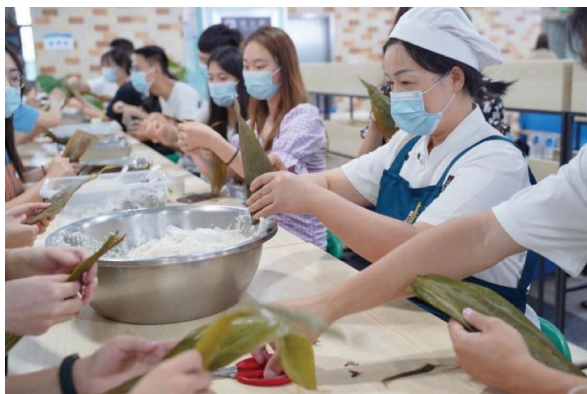
图为师生一起包粽子