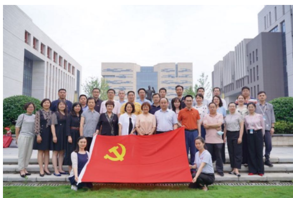
图为全体党员同志参观未来城校区后合影