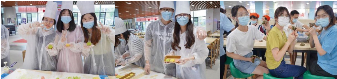
图为同学们在实践课中快乐地合影

在传统节日开展实践课程，不仅让同学们体悟传统民俗，也进一步弘扬了中华优秀传统文化，激发爱国主义情感，达到润物无声的劳动育人目的。此次劳动实践课堂上现场成功包制了约200枚粽子和500块绿豆糕，同学们纷纷合影留念，开心的品尝自己的劳动果实。