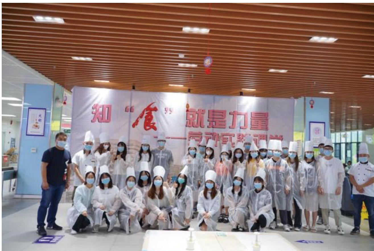
图为活动结束后师生合影留念

后续，未来城校区管理办公室将持续开设【知“食”就是力量】劳动实践课堂，引入更加丰富的美食制作、科普等课程，欢迎所有同学们积极参与，让我们一起在劳动中体验生活，在实践中收获成长！