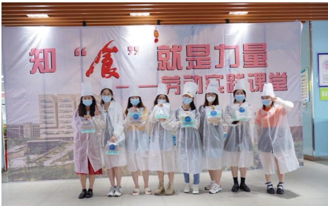
图为同学们在劳动实践课上拍照留念

教工食堂、学一食堂等服务单位积极准备，提前布置场地，支展架、备食材，共同营造热烈欢欣的节日氛围，让师生们感受到在校如在家般的温暖。