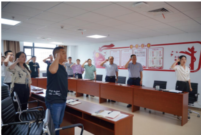
图为全体党员重温入党誓词

按照党支部换届选举程序，会议表决通过了选举办法、候选人名单和监票人、计票人名单。大会以无记名投票方式，差额选举产生了新一届党支部支部委员会。