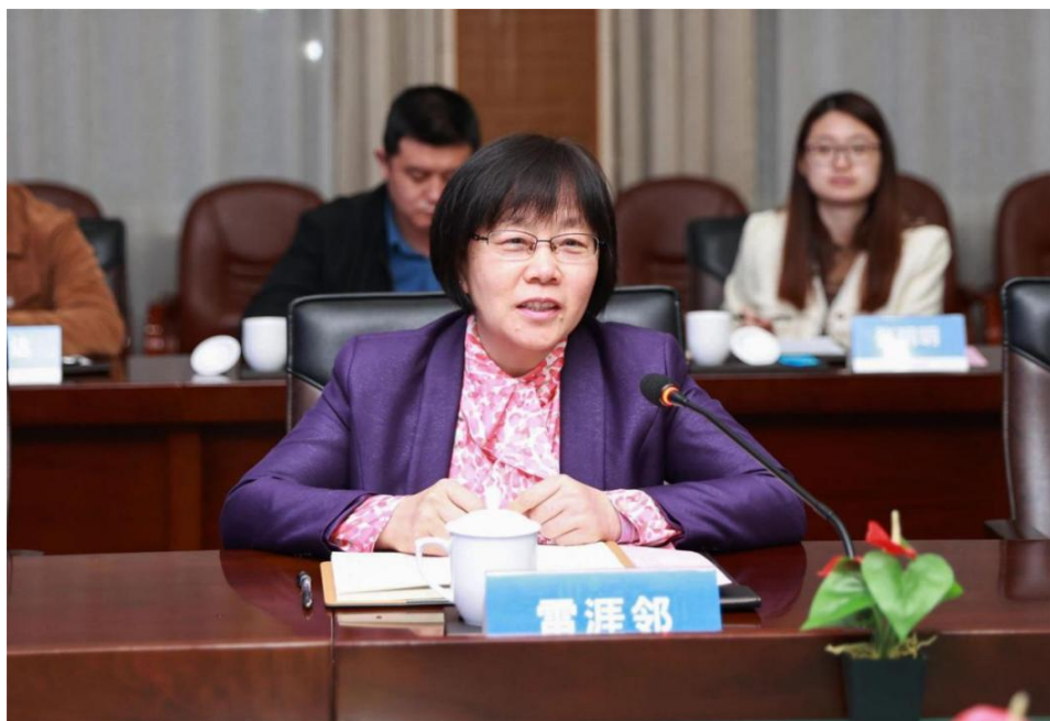
图为中国地质大学（北京）校党委书记雷涯邻发言

雷涯邻表示来到武汉非常激动，对学校周到安排表示感谢。她说，中国地质大学（北京）和中国地质大学（武汉）是亲兄弟，希望两校建立校领导定期会面机制、重要人才共享机制、重要平台共建机制、实习基地共用机制、国际排名共创机制，在人才培养、学位点建设、学科发展等方面深化合作，实现两校共同发展。