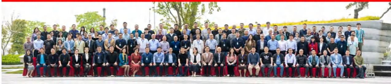
图为会议合影留念

湖北省高等学校后勤管理研究会智慧后勤与能源管理专业部2022年年会暨湖北高校智慧绿色水电发展培训