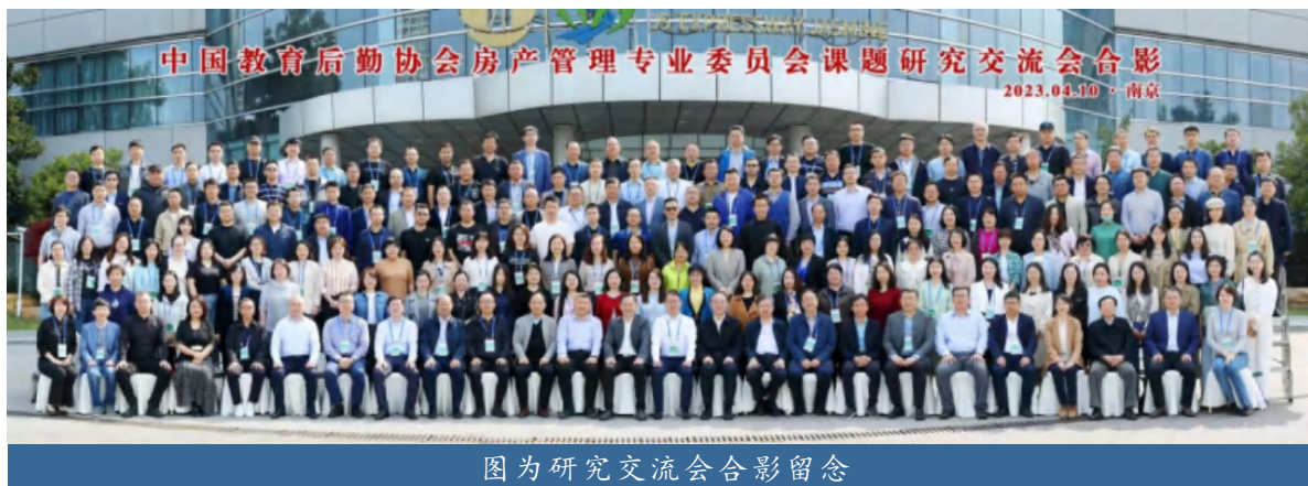
图为研究交流会合影留念

（通讯员 曾成 吴堂明）4月11日，“中国教育后勤协会房产管理专业委员会课题调研交流会”“中国教育后勤协会伙食管理专业委员会暨高校餐饮高质量发展论坛”在江苏省南京市召开，未来城校区管理办公室与后勤保障部，共同参加会议。