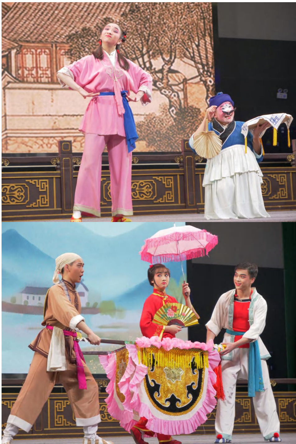
图为青年演员表演现场

为增强大学生的文化艺术素养，我校大学生艺术教育中心将继续依托中华优秀传统文化传承基地、高雅艺术进校园、大学生艺术节等品牌，不断推动中华优秀传统文化的创造性转化和创新性发展，让更多青年学生在中华优秀传统文化浸润中坚定文化自信。