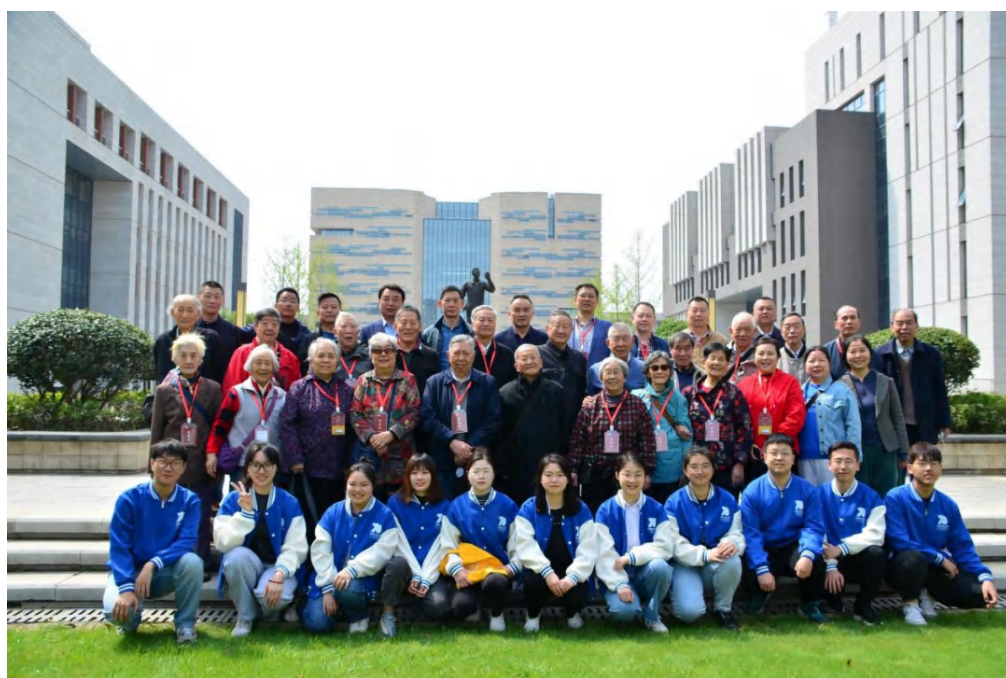
图为住京老同志和未来城师生合影留念