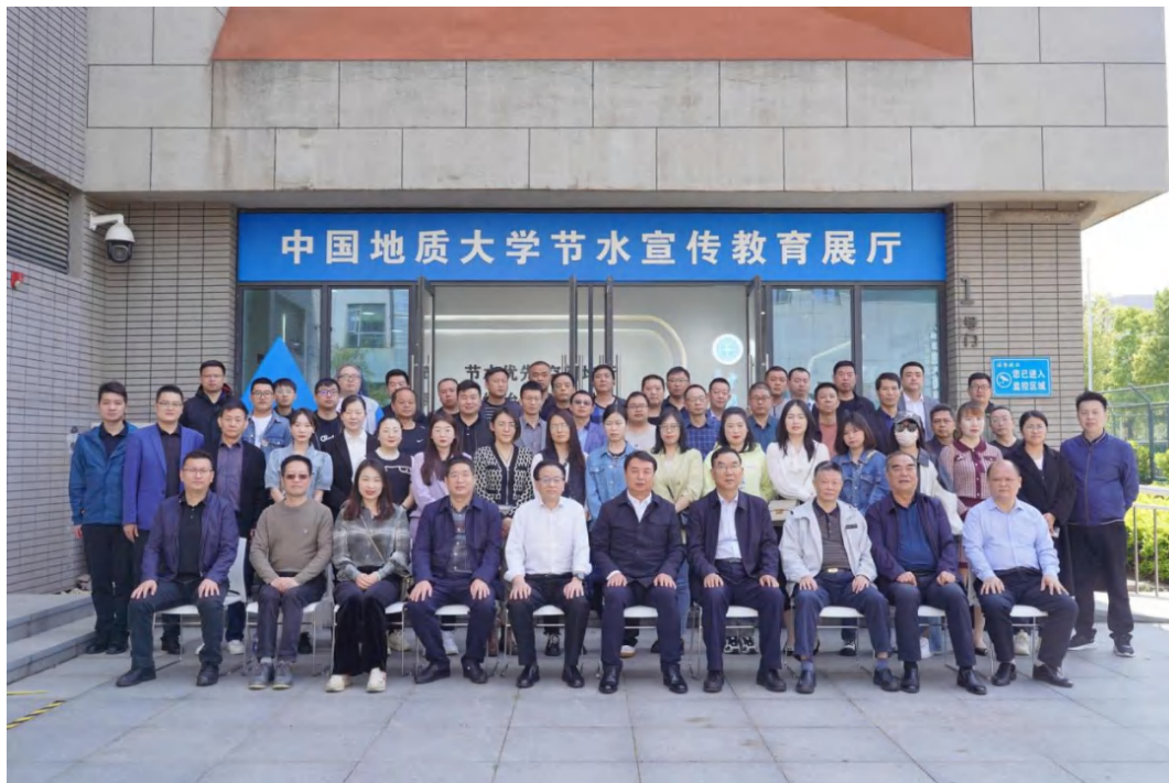
图为与会人员合影留念