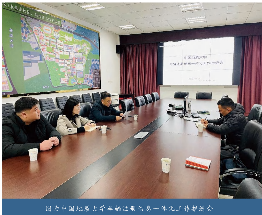
图为中国地质大学车辆注册信息一体化工作推进会

因两校区门禁硬件目前无法在技术上实现实时对接，校区管理办与安全保卫部多次就数据传输问题进行沟通，双方一致认为，先对现有数据库进行合并，在技术无法数据实时对接的情况下由双方工作人员确认后分别录入两校区系统，同时在未来城校区新增线下办理资料审核及缴费点，避免出现师生在两校区奔波办理的情况。