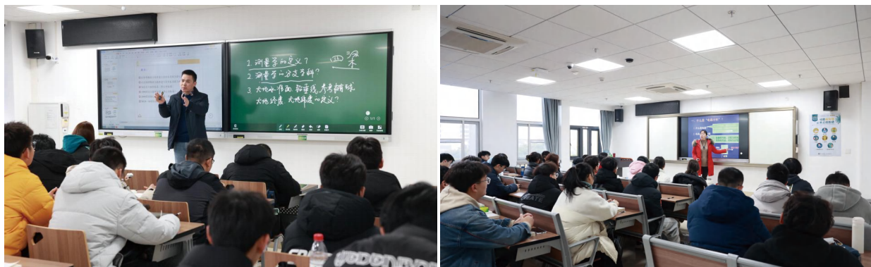
图为智慧教室课堂实景

据悉，在开学前一周，为保障全校所有教室运转正常，信息化工作办公室、后勤保障部、本科生院、研究生院、未来城校区管理办等多部门联合对每个教室，逐个检查网络与教学软硬件状况，排除多处网络、设备等故障，确保开学教学的正常运转。（编辑 王俊芳 审稿 陈华文）