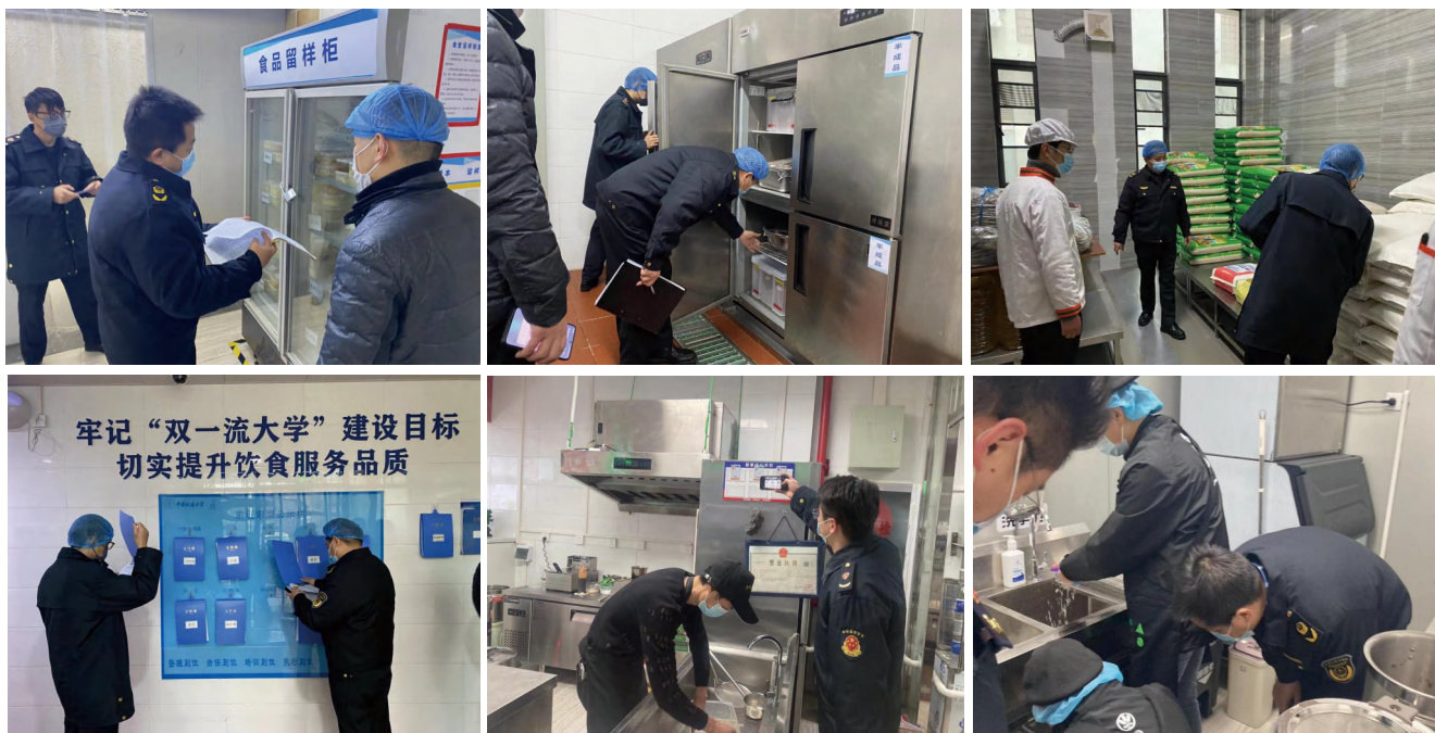
图为检查组开展校区餐饮专项检查

检查组查看了各食堂及中商负一层餐饮门店的环境卫生、食品卫生许可证、工作人员健康证、原材料采购台帐等；逐一检查操作间、加工间、留样柜、食品仓库等区域的安全卫生。