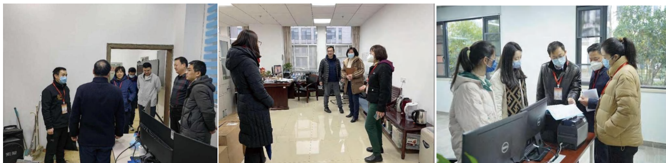
图为督查人员分四组在南望山校区及未来城校区开展走访督导

2月13日上午，督查人员分四组在南望山校区及未来城校区开展走访督导，对各单位到岗情况、职工精神风貌、办公环境进行检查，并与各部门负责人及工作人员开展交流，了解假期及新学期相关工作进展，听取师生员工对机关工作的意见和建议，并积极发掘各单位在作风建设等方面好的典型经验及做法。