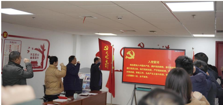
图为未来城校区管理办公室党支部组织生活会会议现场

张玮书记强调，支部全体党员要加强政治理论学习，提升应对变局危局能力，加强对工作规律认识，全面提升校区服务保障能力。