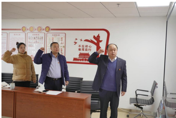
图为未来城校区管理办公室党支部组织生活会会议现场

会上，全体党员对照党中央和习近平总书记的要求和号召，对照党章和入党誓词，对照革命先辈和先进典型，结合自身工作实际，联系实际进行党性分析，深刻检视存在的不足及问题，认真剖析原因，明确整改方向，开展了批评与自我批评。